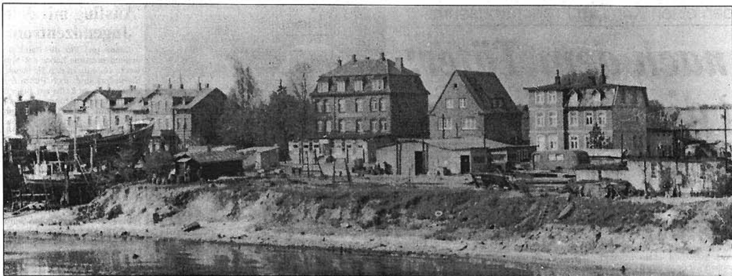
Die Schiffswerft Gebr. Friedrich kurz nach dem Krieg: Das Wertgelände am Prieser Strand hatte damals noch Werkstatt-Charakter.